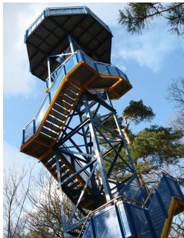
Aussichtsturm auf dem Kolkturnberg

Karte lange Runde: https://www.alltrails.com/explore/map/dolauer-heide-wandertour-14adolauer-heide-grosse-runde?referrer=gpsies