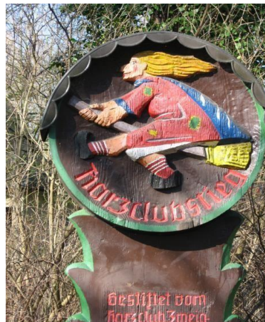
Schild am Harzclubstieg