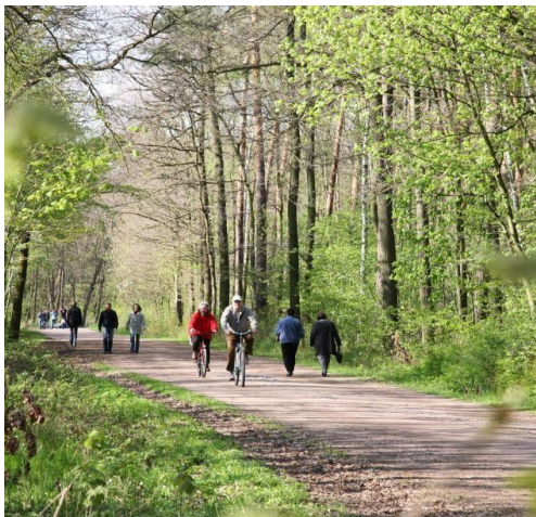
In der Dölauer Heide

Die Kleine Heidetour verläuft über den Krankenbergr, Heidefriedhof und Langen Berg auf die Bischofswiese, wo am 1. Mai 1890 die erste Maifeier der halleschen Arbeiter nach Aufhebung der Sozialistengesetze stattfand. Der Ursprung der Waldparzelle fällt in die Zeit von Christian Wilhelm zu Brandenburg (1587 –1665). Der „Bischof“ genannte Administrator des Erzstiftes Magdeburg ließ den Wald aufforsten und einen Wildpark anlegen. Durch die Wolfsschlucht, in der nach dem 30-jährigen Krieg Wölfe beobachtet wurden, führt der Weg hinauf zum 133 m hohen Kolkturnberg, benannt nach der 1869 gegründeten „Kolkgesellschaft“, die den Humor, das „Ulken“ oder „Kolken“ pflegte. Der 15 m hohe Aussichtsturm ermöglicht einen imposanten Rundblick auf die Dölauer Heide und auf die umgebende Landschaft.