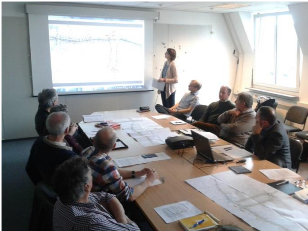
Sitzung am Runden Tisch Radverkehr

Der Runde Tisch Radverkehr ist ein von der Stadt Halle (Saale) einberufenes Gremium, in dem Akteure aus verschiedenen Behörden, Institutionen, politischen Gruppierungen, Vereinen u. a. über Möglichkeiten der Verbesserung der Radverkehrsbedingungen in der Stadt Halle (Saale) beraten. Dabei ist der Kreis auch offen für interessierte Radfahrerinnen und Radfahrer.