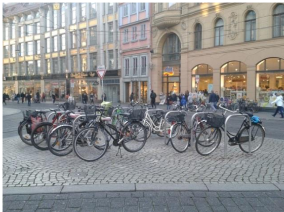
Fahrradbügel am Kleinschmieden

Am 28.09.2016 beschloss der Stadtrat die 1. Änderung der Stellplatzsatzung der Stadt Halle (Saale). Aufgrund dieser Satzungsänderung müssen nunmehr auch bei privaten Bauvorhaben Abstellplätze für Fahrräder nachgewiesen werden 6 .