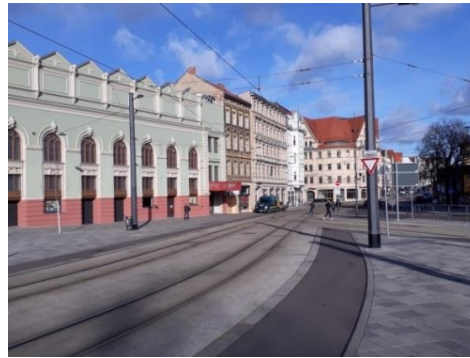
Radweg am Steintor