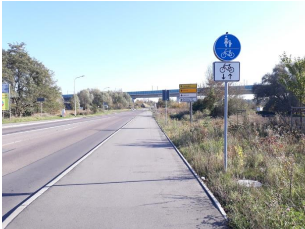
Geh- und Radweg zwischen Osendorf und Döllnitz