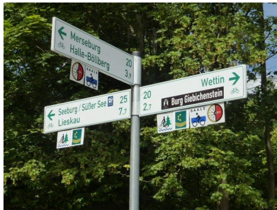
Zielwegweiser an touristischen Radrouten auf der Peißnitzinsel