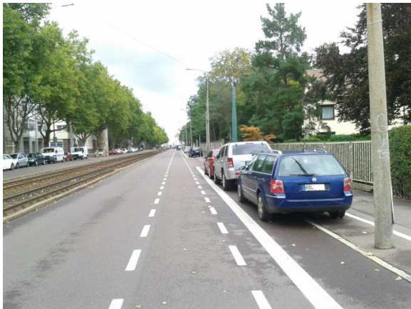
Schutzstreifen in der Elsa-Brändström-Straße