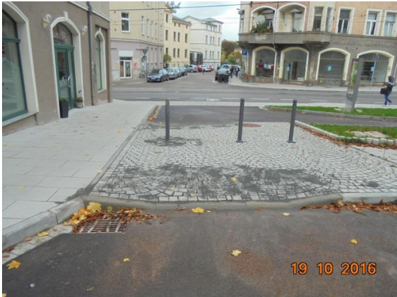
Bordabsenkungen am Franzosenweg (Ermöglichung der Überfahrt für Radfahrerinnen und Radfahrer)