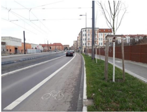
Umgestalteter Böllberger Weg