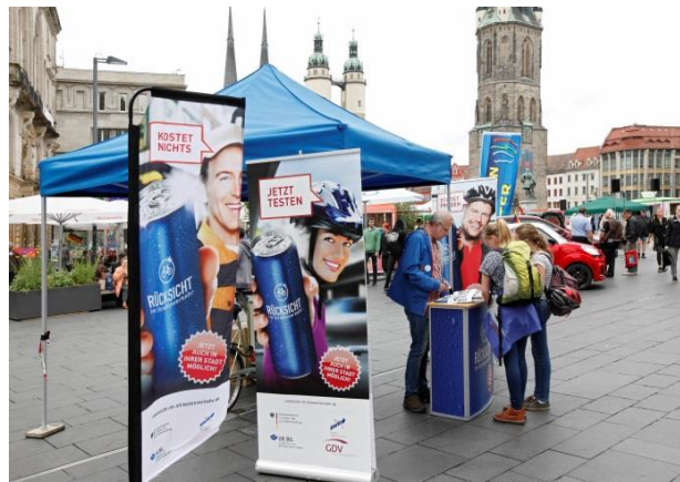
Informationsstand des Fuß- und Radverkehrsbeauftragten beim Verkehrssicherheitstag auf dem Marktplatz