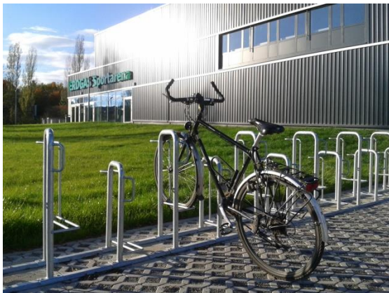
Fahrradbügel an der Erdgas-Sportarena