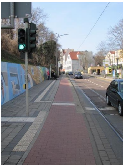
Radweg Kröllwitzer Straße