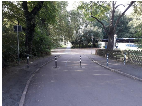
Aufgeweitete Pollerreihe an der Peißnitzbrücke zur Verhinderung von Kollisionen mit Pollern