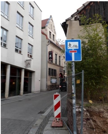
Als durchlässig ausgeschilderte Sackgasse (hier: Gr. Nikolaistraße)