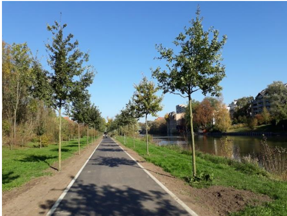
Saale-Radweg zwischen Hafenbahnbrücke und Holzplatz