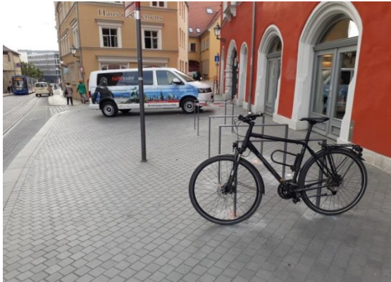
Fahrradbügel am Marktschlösschen