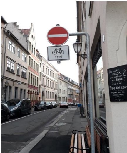
Für Radverkehr frei gegebene Einbahnstraße (hier Barfüßerstraße)