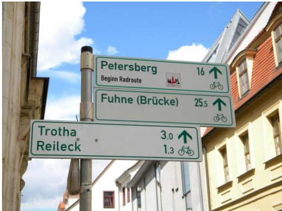
Wegweiser am Händelhaus

Die Zuständigkeit für die Ausschilderung der übrigen Radrouten liegt bei der Stadt. Auch hier liegt der Schwerpunkt bei der Qualitätssicherung an der vorhandenen Beschilderung.