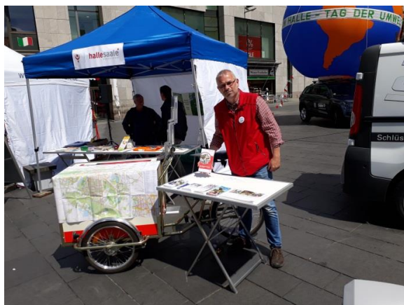
Informationsstand des Fuß- und Radverkehrsbeauftragten beim Fahrrad- und Umwelttag auf dem Marktplatz

Neben den genannten Veröffentlichungen und Aktivitäten gab es in den vergangenen Jahren auch eine Reihe weiterer Maßnahmen der Öffentlichkeitsarbeit wie Pressemitteilungen und Artikel zum Thema Radverkehr sowie Beteiligungen an Fernseh- und Radiointerviews (z. B. MDR, Radio Corax).