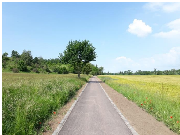
Saale-Radweg zwischen Lettin und Stadtgrenze

Folgende Vorhaben sind in der baulichen Realisierung: