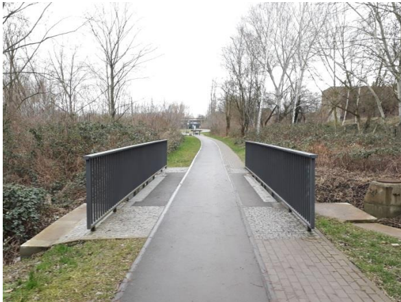
Hafenbahntrasse im Bereich Holzplatz