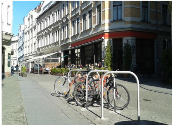
Fahrradbügel in der Kleinen Ulrichstraße