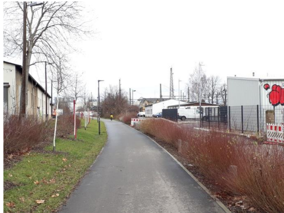
Hafenbahntrasse zwischen Raffineriestraße und Ernst-Kamieth-Straße