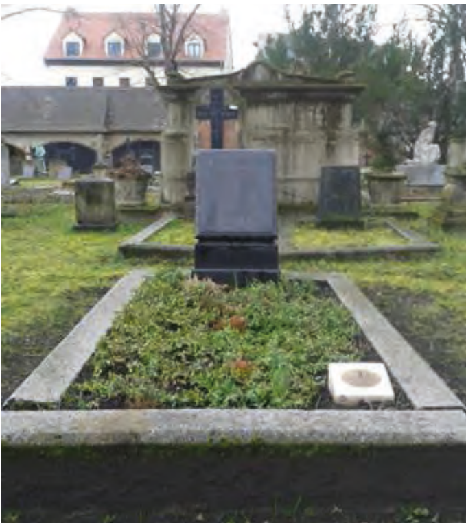
Grabstätte einer Patenschaft auf dem Stadtgottesacker

Die Stadt Halle (Saale) möchte gemeinsam mit Ihnen und dem Verein für Friedhofskultur in Halle und Umgebung e. V. diese historisch wertvollen Zeitzeugen für die nachfolgenden Generationen erhalten.