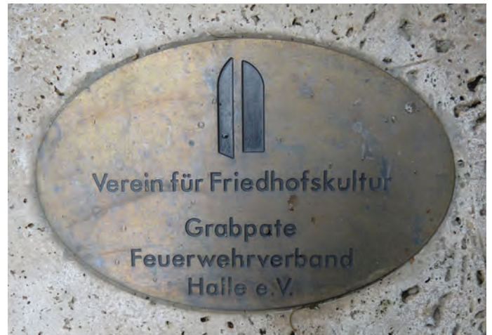
Messingplatte zur Kennzeichnung einer Grab-Patenschaft

Als Grab-Pate verpflichten Sie sich, innerhalb einer individuell vereinbarten Zeit für die professionelle Reinigung oder Sanierung und die Standsicherheit des Grabmals zu sorgen. Natürlich hilft es auch schon, wenn sich jemand verpflichtet, eine Grabstätte regelmäßig zu pflegen und zu bepflanzen. Diese Modalitäten können individuell im Patenschaftsvertrag geregelt werden. Die Kenntlichmachung der Patenschaft an einer Grabstätte erfolgt mittels einer Plakette in Form einer Messingplatte.