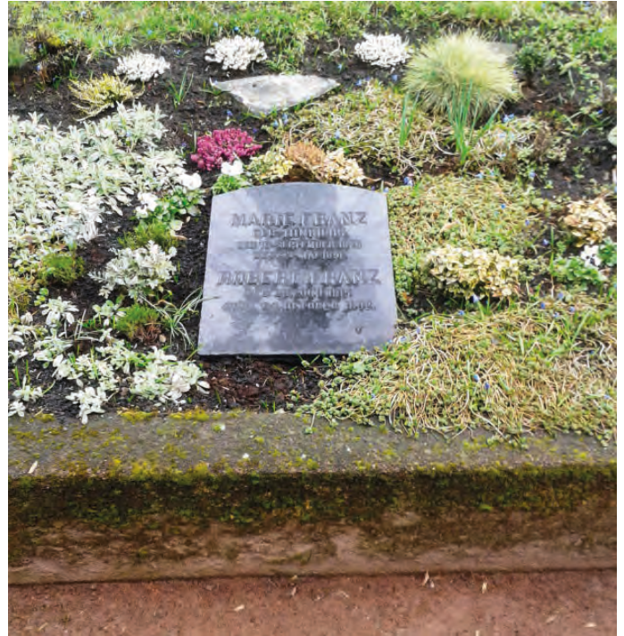
Grab-Patenschaft auf dem Stadtgottesacker (Beispiel)

Egal, welcher Grund Sie zur Übernahme einer Grab-Patenschaft motiviert, Sie helfen, wertvolle Zeugnisse der Friedhofkultur auch für künftige Generationen zu erhalten. Mit Ihrer Hilfe beim Erhalt historischer Gräber kann die besondere Atmosphäre der Ruhe und Besinnung auf städtischen Friedhöfen weiterhin bewahrt werden.